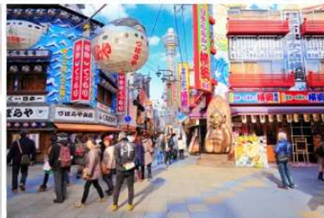
大阪観光も日帰りで行ける！