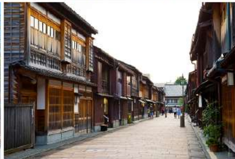
金沢のひがし茶屋街