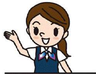
他の時期や方面もお得なプランございます！