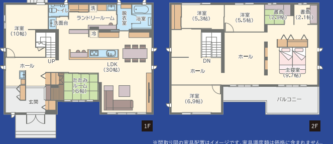
※間取り図の家具配置はイメージです。家具調度は価格に含まれません。