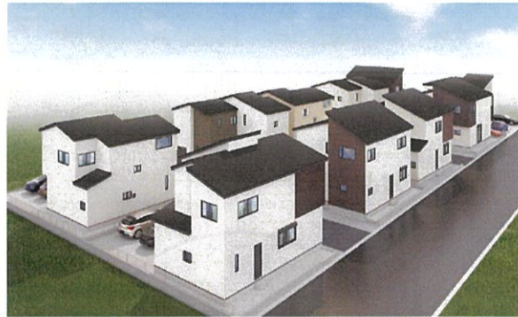
外観完成予想CG ※外構・植栽はイメージであり施工上の都合により変更となる場合がございます。